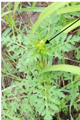
Épi floral sur jeune plant. Photo du 14/09. Gard.

Toutefois, on peut observer actuellement une très grande diversité de stades physiologiques : les ambrosies qui ont été fauchées ou mal désherbées sont retardées, et la grenaison pourra avoir lieu jusqu'à octobre. De même, dans les secteurs qui ont reçu les pluies de fin août, des germinations d'ambrosies ont eu lieu. Les plantes ont alors un cycle très court, comme le montre la photo, et seront capables de produire quelques graines qui leur permettront d'assurer leur survie.