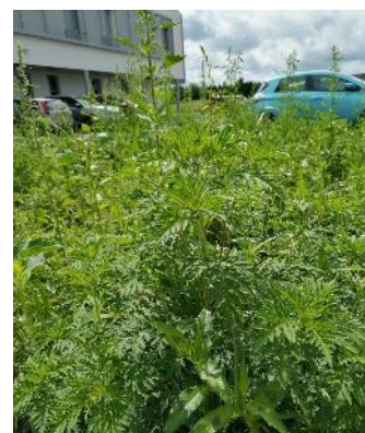
L'ambroisie découverte dans le parterre de l'EHPAD

Pour finir, face au constat que la gestion et l'entretien des espaces verts de l'EHPAD ne sont pas directement assurés par leurs soins, mais qu'il s'agit d'une prestation commandée auprès d'un Etablissement ou Service d'Aide par le Travail (ESAT), le CPIE a proposé à l'ARS qu'une formation spécifique à destination de ces structures soit mise en place afin de les sensibiliser à la problématique de l'Ambroisie et aux modes de gestion appropriés à sa présence.