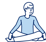
Je fais des activités sans effort